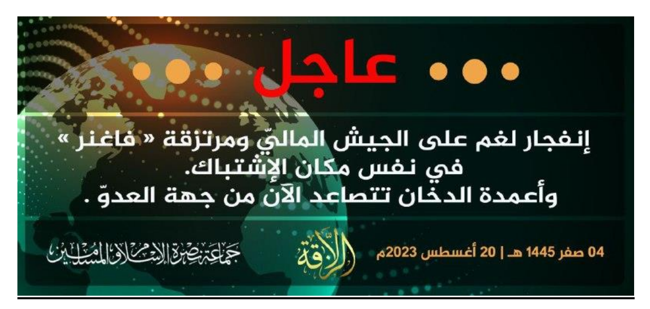
Translation: A large explosion just occurred in the same area. Smoke is momentarily blocking the view on the enemy's side.