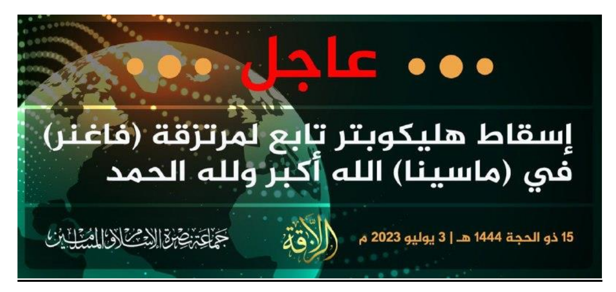
Translation: A helicopter of the Wagner Group has been taken down in (Macina), God is great, praise God. (July 3 2023)