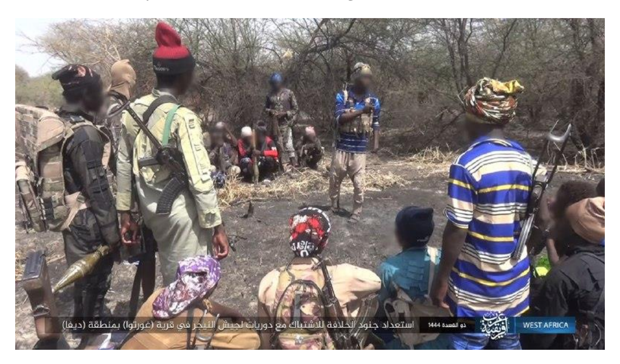
ولاية غرب إفريقية صور: اشتباك جنود الخلافة مع دوريات لجيش النيجر المرتد في قرية (غورتوا) بمنطقة (ديفا)

<u>Translation:</u> West-Africa Province. Soldiers of the caliphate clash with the murtad Nigerien army in the village (Gortoa) in the area of (Diffa).