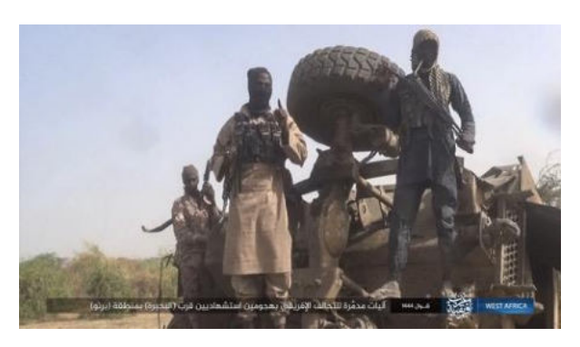
(last picture was withheld from publication due to extremely graphic content)